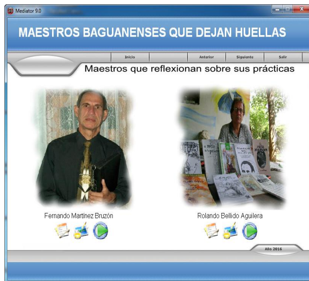
Fig.2 Maestros destacados del siglo XX (Tomado de la Multimedia "Maestros baguanenses que dejan huellas")

Se incluye por último un espacio para los educadores que han sido reconocidos por la Asociación de Pedagogos como maestros