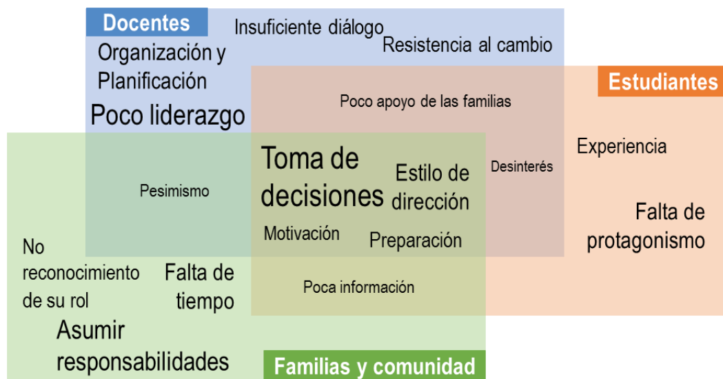
Fig. 3. Limitaciones para participar en la construcción del currículo institucional.

La figura presenta los conceptos asociados a limitaciones de los actores educativos para participar en la construcción del currículo. Los conceptos con mayor presencia son graficados con un tamaño de letra mayor. Se identifican los conceptos comunes en las áreas donde se integran los colores.